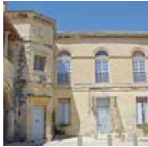
Barbentane, Maison dite des « Consuls »