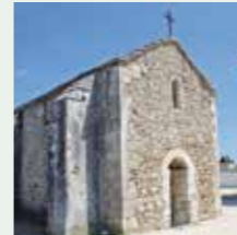
Mollèges, Chapelle St-Thomas