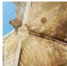
Châteaurenard, Château Féodal

Érigé entre le XIII e et le XV e siècle, il domine la ville. Construit sur la base d'un trapèze fortifié cantonné de 4 tours, il fut fortement endommagé à la Révolution.