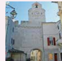
Noves, Porte des Moulins ou de l'Horloge