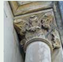
Mollèges, Eglise St-Pierre-ès-Liens