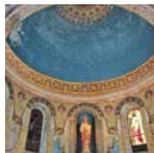
Cabannes, chœur de l'Eglise et clocher