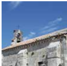
Cabannes, Chapelle St-Michel

Bâtie sur l'emplacement d'un monument romain et contemporaine du château, elle a conservé l'allure des édifices religieux du XI e au XV e siècle avec ses contreforts très apparents.