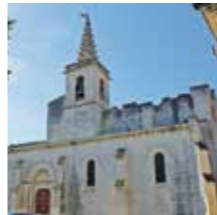
Eyragues, Eglise St-Maxime