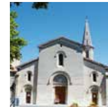
Rognonas, Eglise St-Pierre

Cette église fut édifée sur l'emplacement d'une chapelle du XII e siècle érigée par le pape Adrien IV et dédiée à Saint-Pierre-ès-Lien.