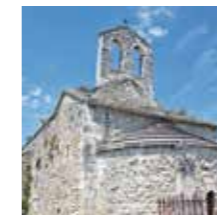
Saint-Andiol, Chapelle Ste-Croix