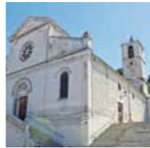
Châteaurenard, Eglise St-Denys

Elle possède une nef centrale romane qui daterait de la fin du XII e siècle/début XIII e siècle. L'ancien chœur roman a été remplacé par un chœur gothique au XVI e siècle.