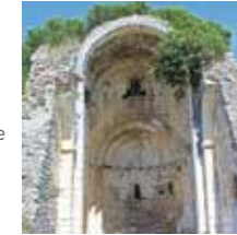
Orgon, Chapelle St-Véran

Ses volumes et son appareillage sont caractéristiques de la Provence romane : une nef unique, avec une voûte en berceau, une abside en cul-de-four, et des moellons ornés de rinceaux à motifs végétaux et géométriques de chaque côté de l'abside.