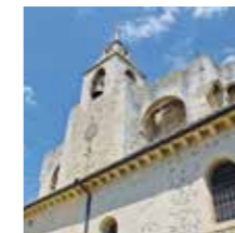
Saint-Andiol, Eglise St-Vincent