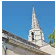
Graveson, Eglise ND de la Nativité de Marie

Reconstruite en 1848 sur une chapelle datant de 1198, chœur composé d'un dôme octogonal sur trompes décoré des quatre évangélistes et abside à colonnades romanes restaurée au XIX e siècle. Nef principale, néo-romane avec voûte en berceau en brique.