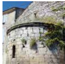
Châteaurenard, Chapelle St-Honorat

C'est un prieuré rural datant de 1102, de style roman pur : abside intacte en forme d'hémicycle, toit de lauzes, voûtes plein cintre et en berceau, petite corniche sculptée.