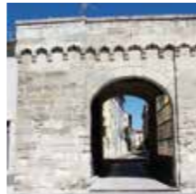
Graveson, Grand Portail