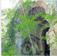
Barbentane, Chapelle de Bagalance