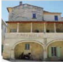
Barbentane, Maison dite des « Chevaliers »