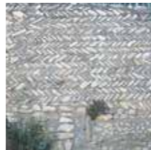
Châteaurenard, Place des Consuls

Mur en arête de poisson, typique de l'époque médiévale et romaine.