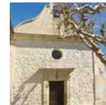
Plan d'Orgon, Eglise St-Louis

L'histoire de cette église montre l'influence de l'art roman dans la région : chapelle érigée en 1835, puis rallongée en 1878 dans un style néo-roman avec chevet à 3 pans, archivolte sur les baies cintrées et cul-de-four.