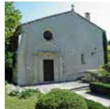
Eyragues, Chapelle St-Bonnet

Elle possède une nef romane provençale qui remonterait au XII e siècle, une abside et un bas-côté nord de style gothique, ainsi que deux chapelles romanes formant un faux transept.