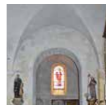
Maillane, Eglise Ste-Agathe

L'église paroissiale originelle, d'origine romane (XIII e siècle), portait le vocable de Notre-Dame-de-Bethléem. Une statue de la Vierge à l'enfant datant de cette époque est encore vénérée de nos jours.