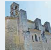
Verquières, Eglise St-Vérédème