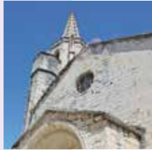
Barbentane, Eglise ND des Grâces