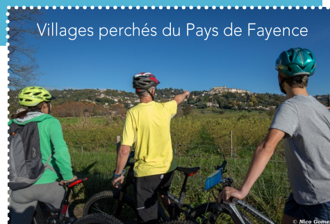
Villages perchés du Pays de Fayence