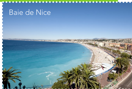
Baie de Nice

Gares de Cannes Golfe Juan, Juan-les-Pins, Antibes, Biot, Villeneuve-Loubet, Cagnes-sur-mer, St-Laurent-du-Var, Nice, Villefranche-sur-Mer, Beaulieu-sur-Mer, Eze, Cap-d'Ail, Monaco, Roquebrune-Cap-Martin, Menton (lignes TER).