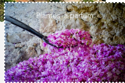
Plantes à parfum