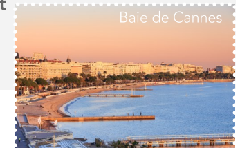
Baie de Cannes

Retrouvez les établissements Accueil Vélo sur www.lamediterraneeavelo.com