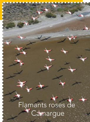
Flamants roses de Camargue

Retrouvez les établissements Accueil Vélo sur www.lamediterraneeavelo.com