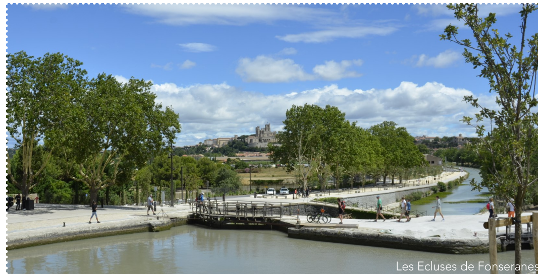
Les Ecluses de Fonseranes

De Narbonne à Sète, en passant par le Biterrois, l'itinéraire suit les berges des trois canaux : Robine, Jonction, puis le canal du Midi autrefois empruntées par les chevaux tractant la Barque de Poste. En suivant le canal du Midi, voie royale, chef d'œuvre du génie de Pierre-Paul Riquet inscrit au Patrimoine Mondial de l'Humanité par l'UNESCO, on remonte le temps : ouvrages d'art exceptionnels, cités millénaires, vignobles et étangs salés émaillent l'itinéraire pour le plus grand plaisir des baroudeurs qui retrouveront, au bout de cette étape en cours d'aménagement : les plages de la Grande Bleue.