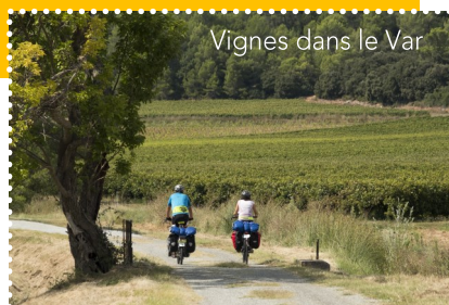
Vignes dans le Var

Retrouvez les établissements Accueil Vélo sur www.lamediterraneeavelo.com