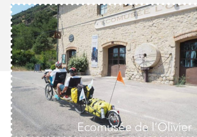
Ecomusée de l'Olivier