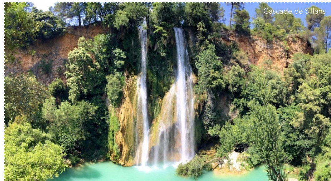
Cascade de Sillans

En Dracénie, territoire labellisé Vignobles et Découvertes, de nombreux domaines viticoles ponctuent le parcours.