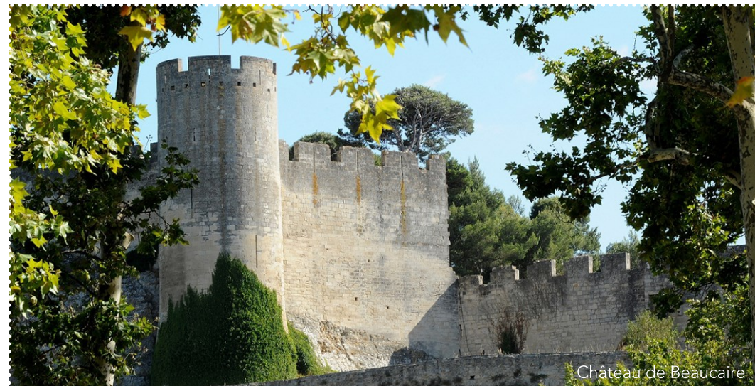
Château de Beaucaire

Depuis Beaucaire, il est possible de rejoindre l'emblématique Pont du Gard par la V66 itinéraire aménagé en majorité en site propre.