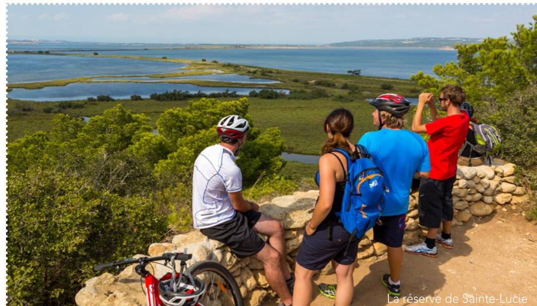
La réserve de Sainte-Lucie

Retrouvez les établissements Accueil Vélo sur www.lamediterraneavelo.com