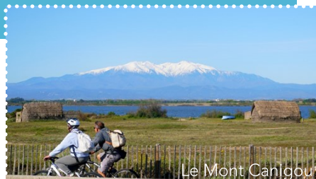
Le Mont Canigou

Gares d'Argelès-sur-Mer, Perpignan, Rivesaltes, Leucate – La Franqui, Port La Nouvelle (grandes lignes), Narbonne.