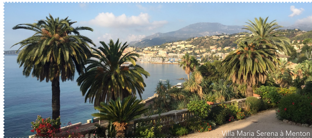
Villa Maria Serena à Menton

Entre Cannes et Nice, l'itinéraire longe le littoral via Antibes Juan-les-Pins, Villeneuve-Loubet, Cagnes-sur-Mer et Saint-Laurent-du-Var. De Nice à Menton, l'itinéraire prend de la hauteur. Pour les familles ou les moins habitués, le vélo à assistance électrique est indispensable pour profiter des panoramas exceptionnels et des villages perchés qui jalonnent la côte. Depuis La Turbie, les points de vue sont grandioses. A Menton, les derniers kilomètres se déroulent le long des plages. Le parcours s'achève en beauté dans l'un des nombreux jardins remarquables de la ville.