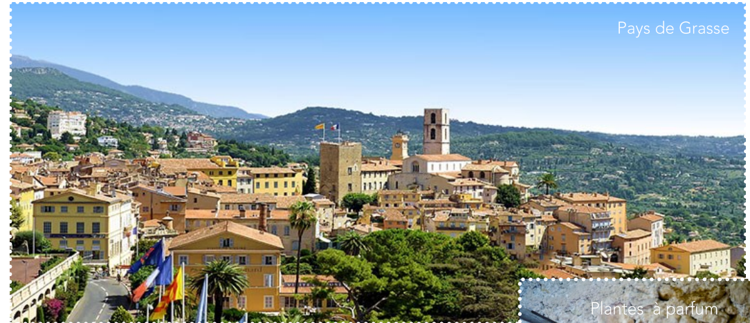
Pays de Grasse

Depuis Draguignan, la véloroute se connecte au village et à la gare des Arcs-sur-Argens via La Vigne à Vélo . Puis elle rejoint Figanières, Callas, Bargemon et Claviers par un itinéraire provisoire. Le parcours traverse ensuite les villages perchés du Pays de Fayence : Seillans, Fayence, Tournettes, Callian et Montauroux en suivant l'ancien tracé du Train des Pignes avant d'enjamber la Siagne, limite naturelle du Var et des Alpes-Maritimes. Entre Le Tignet et la Roquette-sur-Siagne, l'itinéraire traverse les villages du Pays Grassois : Peymeinade, Auribeau-sur-Siagne et Pégomas. En suivant la route des Balcons d'Azur, depuis Peymeinade, il faut 10 km pour rejoindre Grasse, capitale mondiale du parfum. A Mandelieu, l'itinéraire retrouve le bord de mer en direction de Cannes.