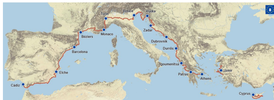
Carte de l'EuroVelo 8

C'est officiel, l'EuroVelo 8 se poursuivra à terme jusqu'en Turquie. L'itinéraire méditerranéen reliera Cadix en Espagne à Izmir en Turquie sur un linéaire de 7500 km à travers 11 pays du bassin méditerranéen.